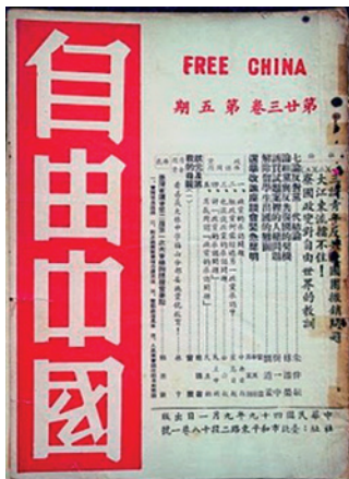
在威權時代，新竹中學就訂閱自由中國雜誌

在當時的中學校，只有竹中訂有《自由中國》雜誌。學校只訂一本，所以我們常常逃課去看。校長進來了，要看《自由中國》，一看到我們在那邊看，就過來大罵：「莫名其妙不上課到這裡來」，把我們趕走，他就拿去看。我們念書的時候，禁書非常多，圖書館藏書有三萬冊，所以有很多二十年代作家的書，我都是在初中看過的。