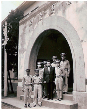
辛校長與僑生合影於新民樓

有些僑生自竹中畢 業後，考上師大、成大、 台大或政大就讀。那個年 代不像現在這麼繁榮， 過年時市面上很冷清，甚 至連吃的東西有錢都買不 到。所以父母親就邀請他 們回新竹來家裡過年。有 些連兄弟姐妹都一起帶 來。最多的時候，大概來 了十幾二十人。這些僑生 現在也都是差不多跟我 這種年紀六、七十歲左