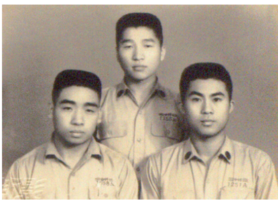
左圖右一為本文作者

我初中先在新竹一中就讀，但是，唸了兩年覺得不對勁，因為每天趕早出門，走半個鐘頭的山路到「竹一一八線