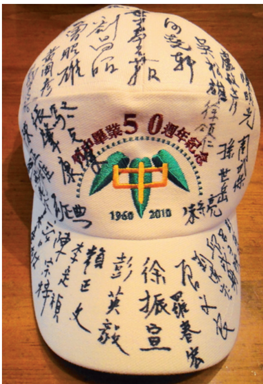
這頂帽子意義非凡，張貴洋學長決定在集滿 100 人簽名時，捐給校史館。